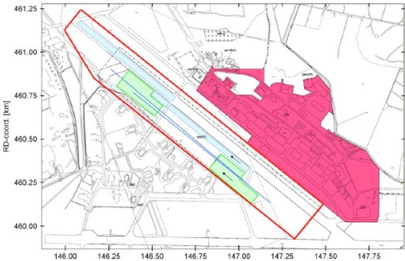
Figuur 1: Plantekening luchthaven Soesterberg in RD-coördinaten